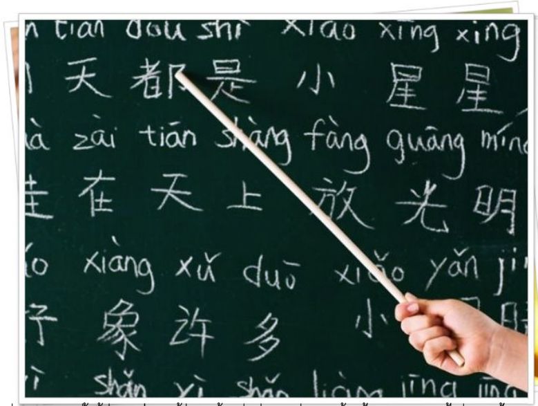
สวัสดีค่ะ... วัตถุประสงค์ของงานนี้คือการส่งเสริมให้นักเรียนได้เรียนรู้ภาษาจีนและวัฒนธรรมจีน