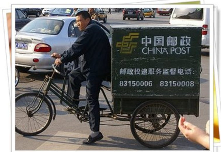
นักเรียนได้เรียนรู้เกี่ยวกับบริการจัดส่งพัสดุของจีน