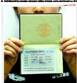
เอกสารราชการจีน