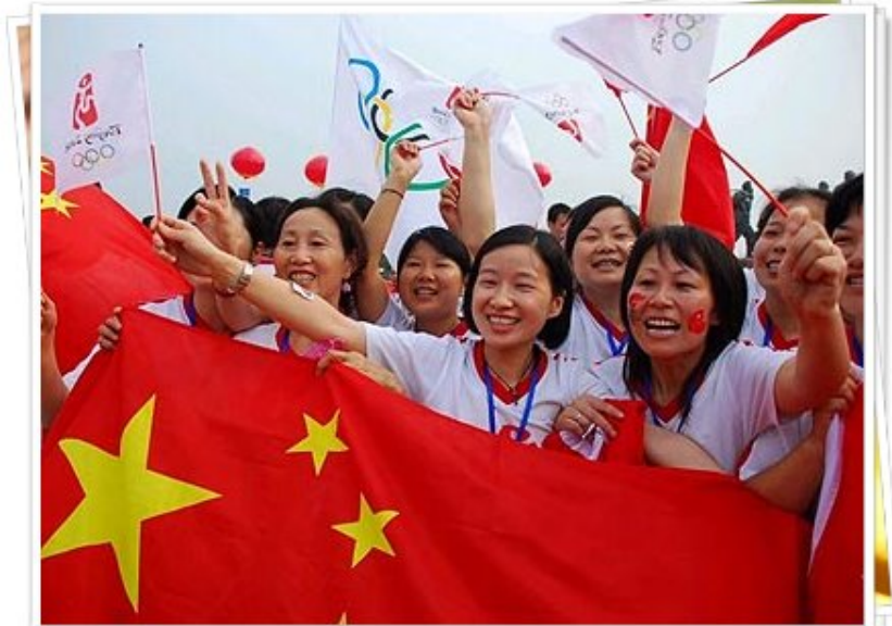
นักเรียนได้เรียนรู้เกี่ยวกับธงชาติและสัญลักษณ์โอลิมปิก