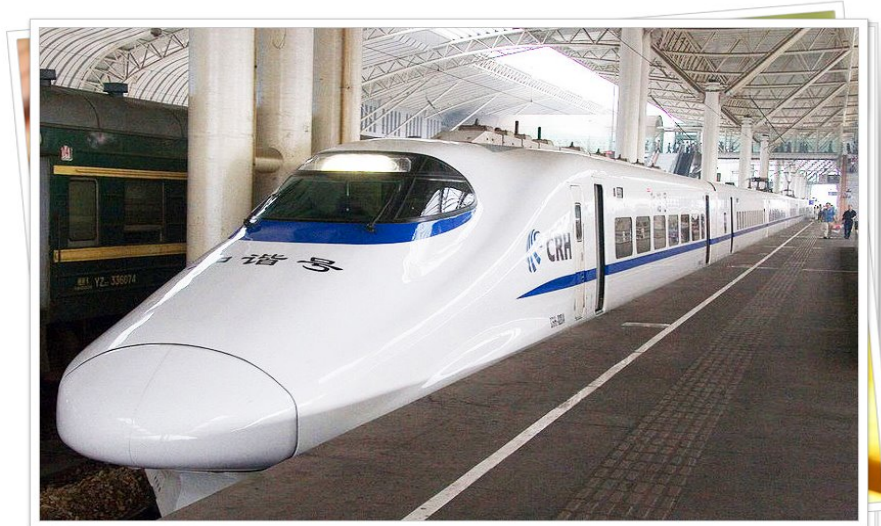
รถไฟความเร็วสูงจีน

วันที่ 13 พฤศจิกายน 2013 เวลา 10:23 น. - แก้ไขล่าสุด วันที่ 13 พฤศจิกายน 2013 เวลา 11:38 น.