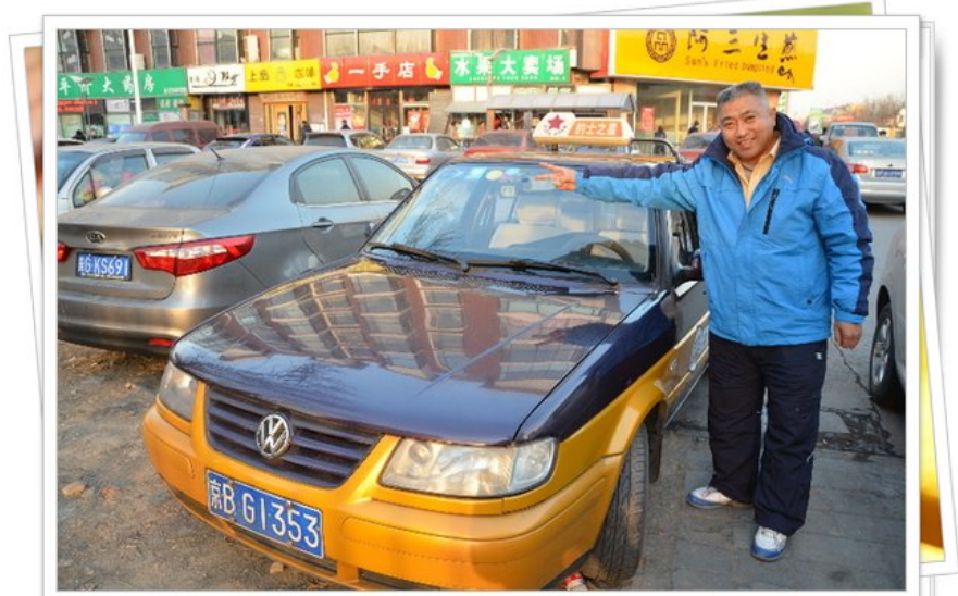
แท็กซี่จีน