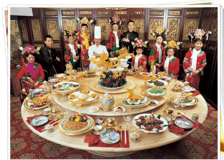
นี่คือสิ่งที่ผมจะแนะนำกับน้องๆ ที่สนใจเรื่องการทำอาหารจีน

วันที่ 13 พฤศจิกายน 2013 เวลา 10:23 น. - แก้ไขล่าสุด วันที่ 13 พฤศจิกายน 2013 เวลา 11:38 น.